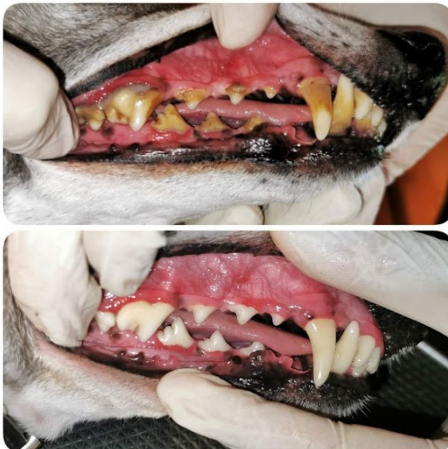
Avant soins dentaires /Après soins dentaires

Après l'intervention votre animal est placé dans un box de réveil et il est surveillé par une infirmière jusqu'à son réveil complet.